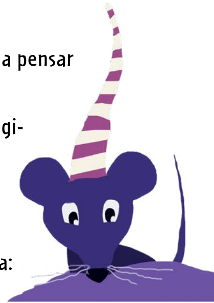
Página 53: Ilustração que acompanha o poema “O rato Roque”.

Ah! Por falar em brincar de se expressar, vá até as páginas 52 e 53 para ver a ilustração que o Guazzelli fez para a poesia “O rato Roque”. Se você apenas olhar o desenho, você consegue imaginar sobre o que fala o poema? Dê uma olhada e lembre-se que a ilustração também tem sua poesia: às vezes, ela não diz exatamente a mesma coisa para todo mundo. Depende dos olhos do leitor, certo? Uma dica: olhe no fundo da imagem e preste atenção no som que começa as palavras “rato” e “Roque”. O que será que esse bichinho vive fazendo o tempo todo?